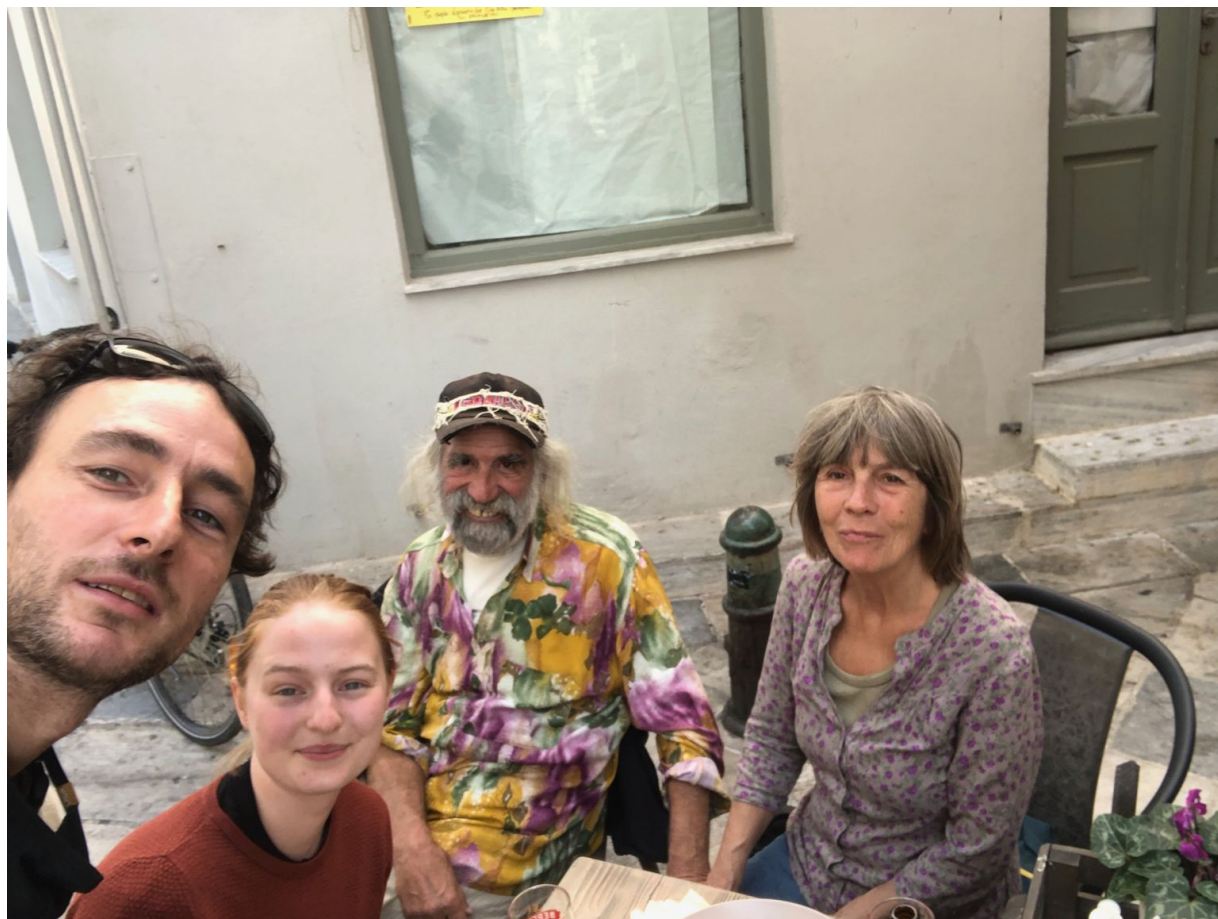
Teos, Chara a my.