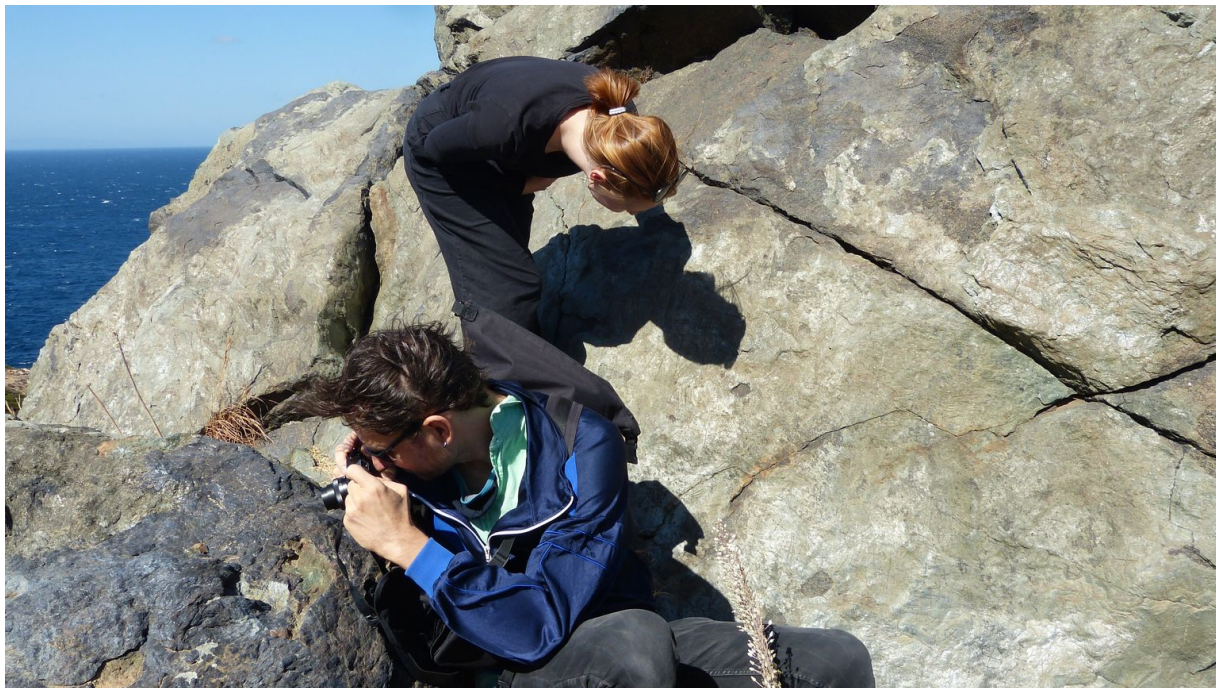
Rytiny, Syros.

Kresby zaznamenávají tvary připomínající hvězdy, hlemýždě, kosočtverce, ale také dávné měrné soustavy, lidské postavy nebo podobu tehdejších lodí. Byly první tápavou formou uschování čili záznamu a přenosu kousku významu a předznamenávají pozdější písmo. Při svém zkoumání těchto rytin, které vydalo na titul Traces , se Teos stal svědkem záznamu tisíce let staré řecké kultury, vývoje jazyka a architektury, čímž se před ním na Syrosu nikdo nijak zvlášť nezabýval. Je stěží uvěřitelné, že v Evropě lze nalézt pozůstatky dosud nepopsané a neinterpretované dávné historie.