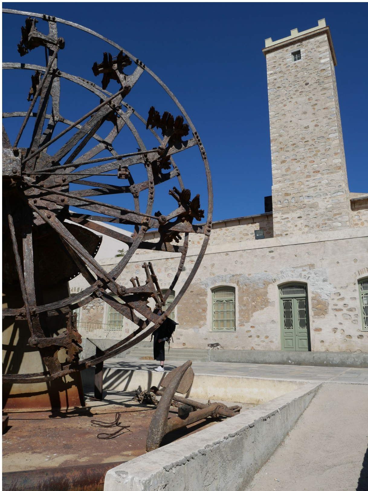
Technické muzeum a pádlovací kolo ztroskotané lodi Patris.

Ztroskotaná Lod Patris je jako ruina poukazující na minulost artefaktem, který vytváří dějiny, avšak dodnes je součástí podmořského ekosystému, a účastní se tak pokračování dějin. Na základě tohoto i jiných příkladů rozpadu a rozkladu