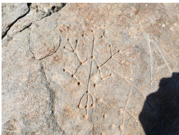
Rytiny, Syros.

Kresby zaznamenávají tvary připomínající hvězdy, hlemýždě, kosočtverce, ale také dávné měrné soustavy, lidské postavy nebo podobu tehdejších lodí. Byly první tápavou formou uschování čili záznamu a přenosu kousku významu a předznamenávají pozdější písmo. Při svém zkoumání těchto rytin, které vydalo na titul Traces , se Teos stal svědkem záznamu tisíce let staré řecké kultury, vývoje jazyka a architektury, čímž se před ním na Syrosu nikdo nijak zvlášť nezabýval. Je stěží uvěřitelné, že v Evropě lze nalézt pozůstatky dosud nepopsané a neinterpretované dávné historie.