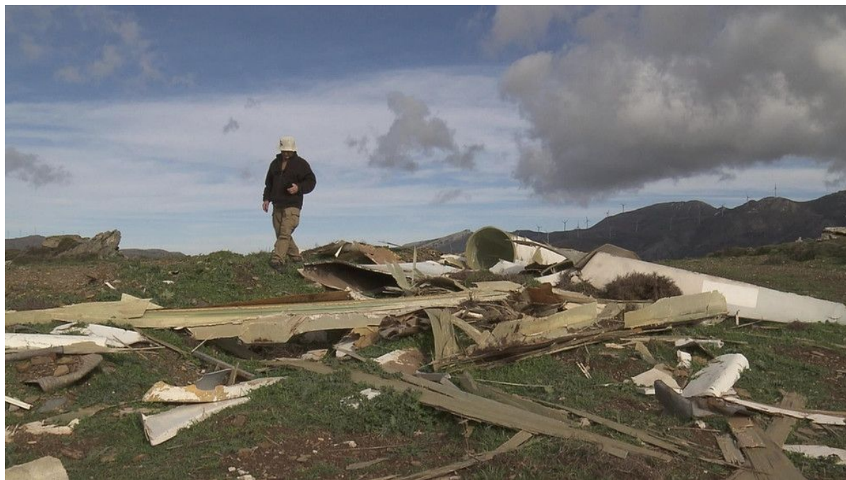
Ruiny větrných turbín na Kykladském ostrově Evia.

boomu zelené energie. Při pohledu na ruiny nefunkčních větrných turbín, které nikdo neopravil ani neodklidil, se dostavuje mysteriózní pocit existenciální tísně: jsme svědky jakési akcelerované historie, která by dost možná mohla být i tou naší, ačkoli v ní vlastní představy o budoucnosti tohoto obnovitelného zdroje nepoznáváme.