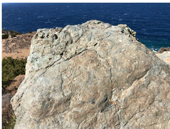
Rytiny, Syros.