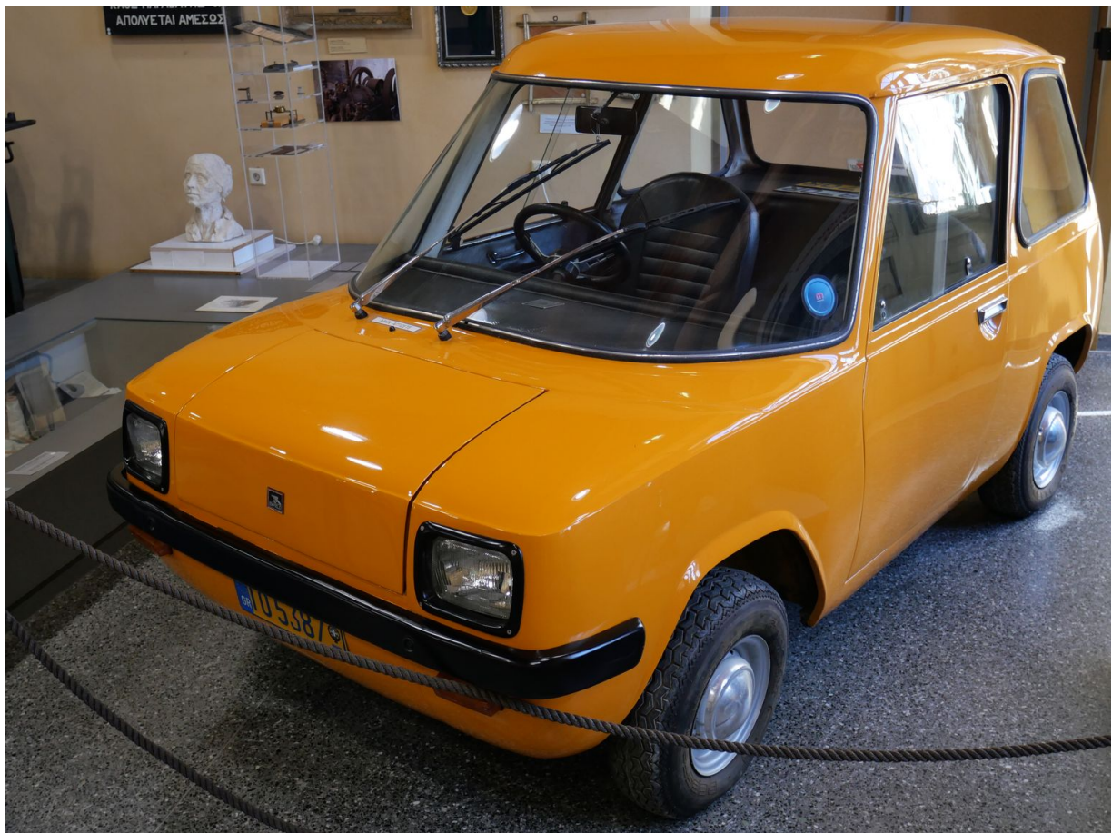
První sériově vyráběné elektroauto v Řecku – a možná i na světě.

průmyslovým centrem a dlouho také největším řeckým přístavem (dnes je jím Piraeus v Athénách). Dodnes tu funguje technická vysoká škola. Ermupoli je také administrativní centrum spravující Kykladské ostrovy, probíhá tu běžný kulturní provoz a žije v něm stabilní komunita lidí. Zvláště mimo sezonu působí civilním dojmem a kromě přímořské promenády a několika obchodních ulic vypadá celkem obyčejně, což vytváří pocit stabilního zázemí, do něhož se z našich cest po odlehlých cípech ostrova rádi vracíme. Industriální historie města skrývá pár kuriozit, na které narážíme v muzeu. Mezi ty nejbizarnější patří elektromobil Enfield 8000, který se zde vyráběl na začátku 70. let a podle místního pamětníka patřil k prvním sériově vyráběným elektromobilům na světě. Baterie vážila kolem 140 kg a nabíjela se 6 hodin. Na Syrosu jsme žel žádný z nich v provozu nezahledli.