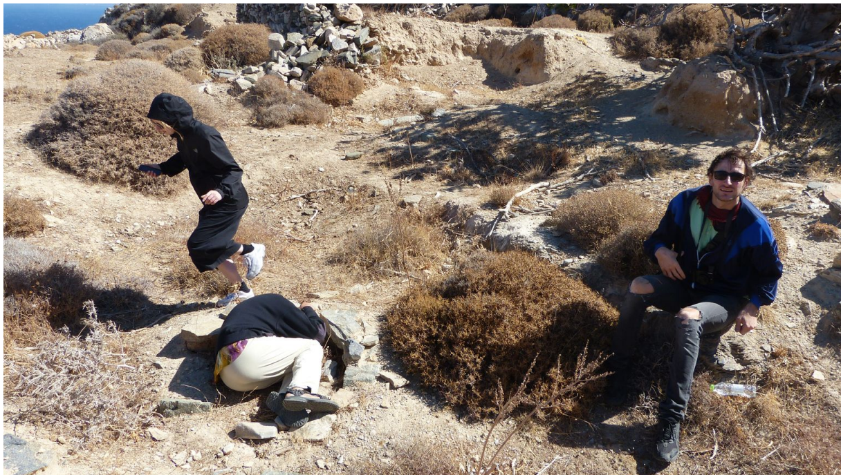
Chalandriani a Kastri, fouká severní vítr. Teos se choulí do klubička u hrobky v místě objevu prehistorického osídlení a pohřebiště. Mrtvé tu ukládali do hrobů v zárodečné poloze. Archiv autorů.

Apano Meria tak v našem zkoumání nabývá dvou rovin – zkušenostní a politické. To místo nás konfrontuje se svou syrovostí a zvláštní krásou, jíž se můžeme dotknout, projít se v ní. Také to však je terén politického boje s procesy ruinace, které vyvěrají z touhy komodifikovat vše, co se na ostrovech komodifikovat dá, zemi, vítr, moře a kulturu. Tyto dvě roviny se přitom proplétají. Bez vztahu k ostrovnímu ekosystému by nevznikala snaha o jeho záchranu – a bez politizace tohoto vztahu by ostrovními obyvatelům brzy moc nezbylo.