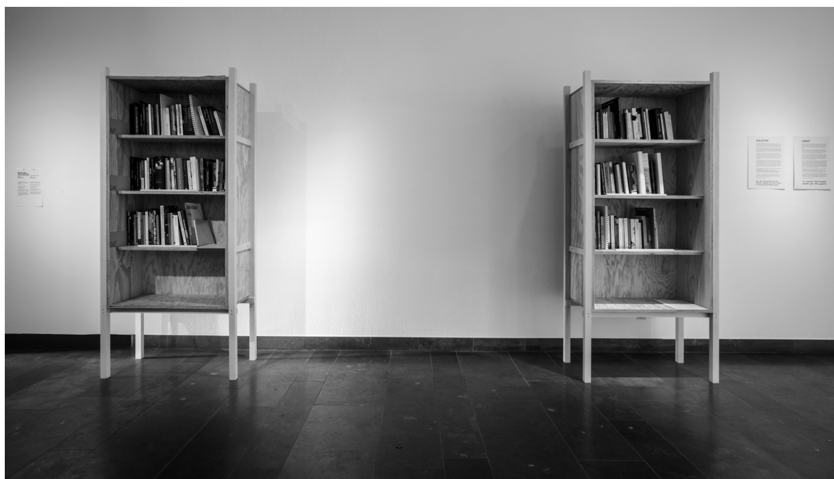
Annie Vigierová & Franck Apertet (les gens d'Uterpan), Knihovna. Pohled do instalace na přehlídce documenta 14, Kassel, 2017.