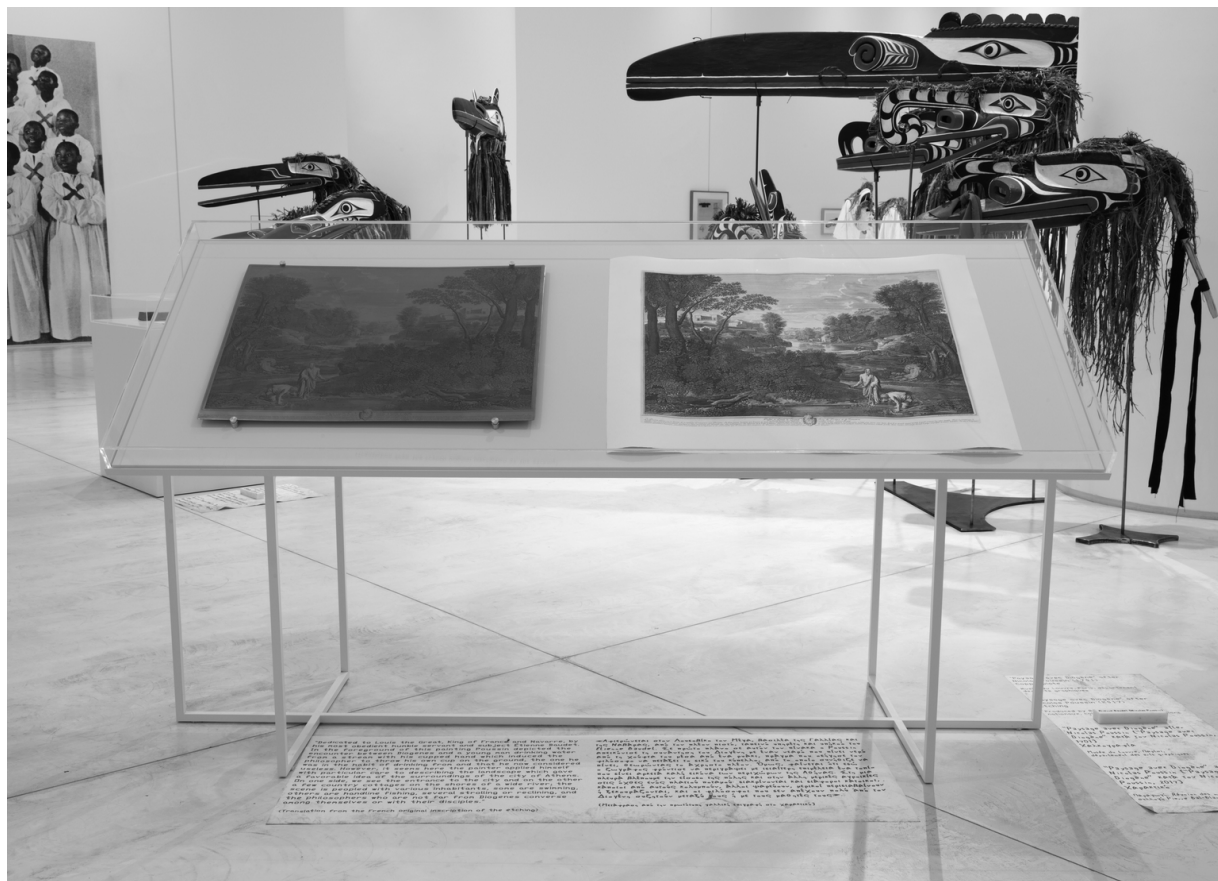
Étienne Baudet, Krajina s Diogenem podle Nicolase Poussina, 1701. Měděná deska, sbírka muzea umění Louvre, oddělení grafiky, Paříž (vlevo). Krajina s Diogenem podle Nicolase Poussina, 2017. Rytina, produkce Réunion des musées nationaux, sbírka Pierra Bal-Blanca (vpravo). Pohled do instalace v EMST – Národním muzeu současného umění v Athénách, documenta 14.